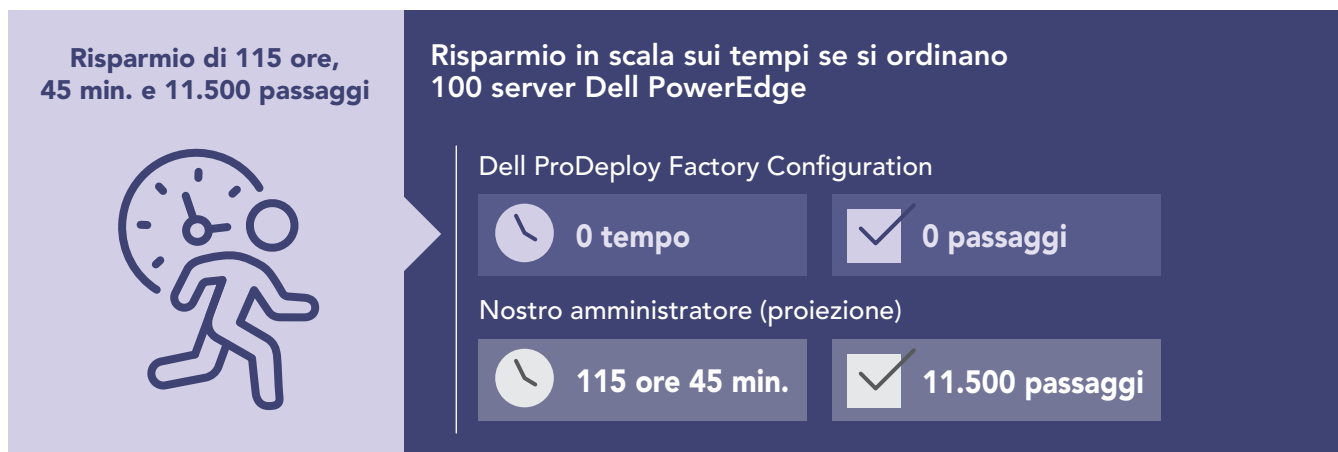
Figura 2: Tempo di amministrazione interna estrapolato, in ore e minuti, e passaggi necessari per configurare 100 server PowerEdge. Valori più bassi indicano risultati migliori.

Le organizzazioni di livello enterprise sostituiscono spesso grandi quantità di server e talvolta devono fornire a più sedi molti server configurati in modo coerente. Il nostro primo scenario di test riflette questi casi d'uso e dimostra probabilmente un valore maggiore conseguente all'uso di ProDeploy Factory Configuration. Per dimostrare quanto tempo un'organizzazione potrebbe risparmiare utilizzando ProDeploy Factory Configuration su un'installazione di server su larga scala, abbiamo estrapolato i tempi rilevati dalla configurazione di un singolo server PowerEdge R750 a 100 server. Come mostra la Figura 2, consentendo al servizio di completare tutte le attività di configurazione per 100 server (invece di farle completare manualmente a un amministratore) si potrebbero risparmiare circa 115 ore, garantendo al contempo che la configurazione rimanga coerente per ogni server durante l'intera installazione.