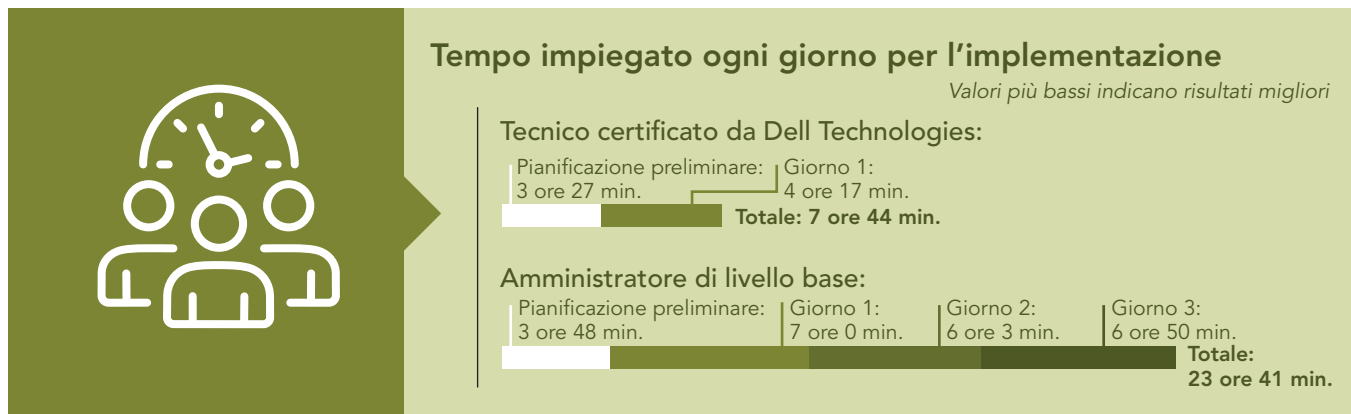
Figura 3: Tempo, in giorni lavorativi, ore e minuti, per l'implementazione della soluzione Dell da parte di un tecnico certificato da Dell Technologies e del nostro amministratore.

Come mostra la Figura 3, senza ProDeploy Plus for Infrastructure, il nostro amministratore ha impiegato 19 ore e 53 minuti per pianificare, installare e configurare la soluzione in tre giorni lavorativi dopo la fase di pre-pianificazione.